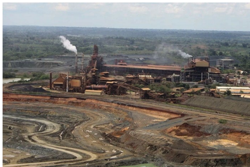
Mina de Cerro Matoso en Montelíbano

reserva de níquel fue descubierta a mediados del siglo pasado, pero fue en marzo de 1963 que la Nación suscribió un contrato con Richmond Petroleum Company, que después cambiaría su nombre a Chevron of Colombia, para que la multinacional explotara níquel en un área de 500 hectáreas por un término de 30 años.