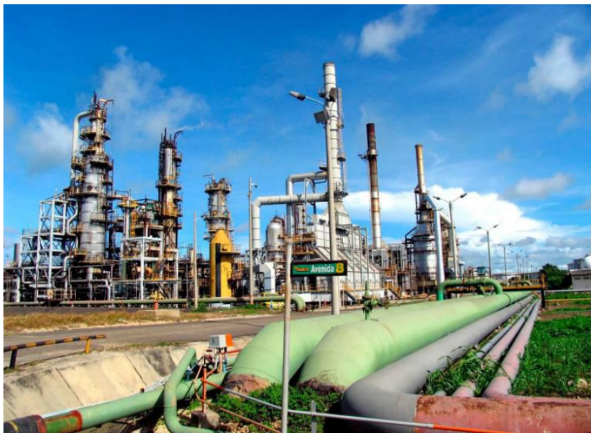
Ecopetrol confirmó que el evento no causó daños en la infraestructura de la refinería ni afectó al personal que trabaja en las instalaciones.

Ecopetrol activó un plan de contingencia tras el incidente en la subestación principal.