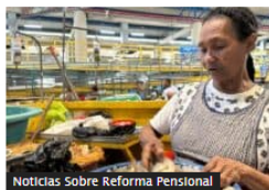
Noticias Sobre Reforma Pensional

Dólar hoy en Colombia tocó un mínimo de $4.082, pero se movió al alza al final de la jornada