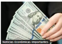
Noticias Económicas Importantes

Dólar hoy en Colombia tocó un mínimo de $4.082, pero se movió al alza al final de la jornada