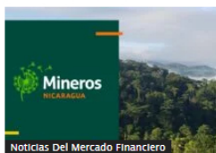
Noticias Del Mercado Financiero

MinHacienda evalúa medidas para liberar caja: operaciones entre entidades y titularizaciones