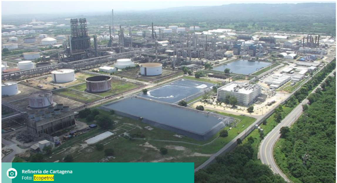
Refinería de Cartagena

La compañía informó que la afectación no generará ningún impacto en el suministro de combustible.