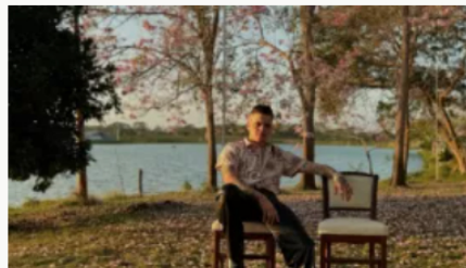
Asesinan al cantante barranquillero Zair Guette