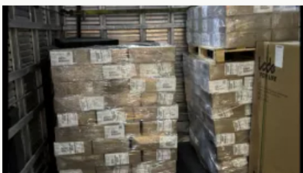
Sociedades científicas piden a Petro "rigor científico" en declaraciones sobre el VIH