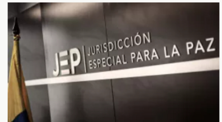
La JEP allana el camino para la implementación de sentencias restaurativas