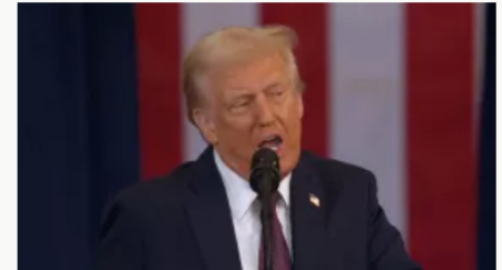
Trump elimina fondos para escuelas que exijan vacunación contra la covid