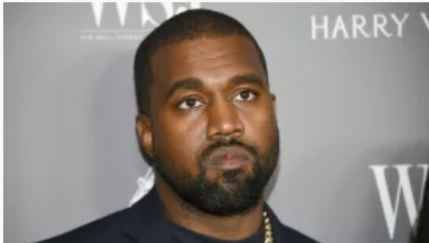
Exempleada de Yeezy presenta demanda contra Kanye West