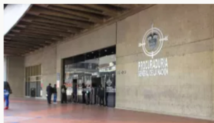
Procuraduría envía comisión a Naturgas tras intervención de la SIC