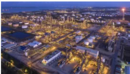
Corte de energía en la refinería de Cartagena debido a una falla eléctrica