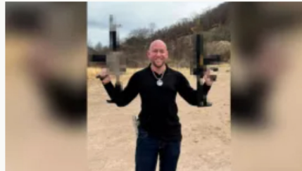
Muere en México narcotraficante holandés