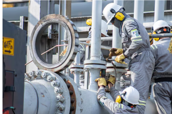
Trabajadores de Ecopetrol.