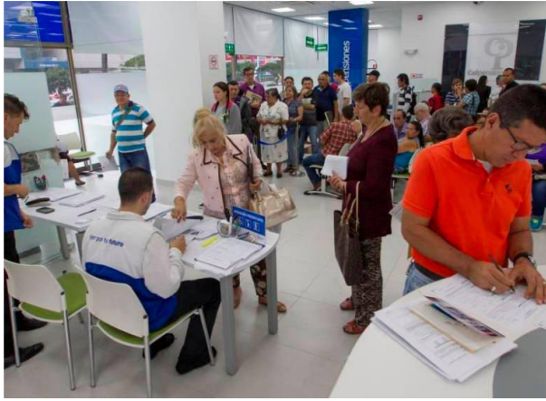
Reforma pensional de Petro entra en vigencia en julio de este año.