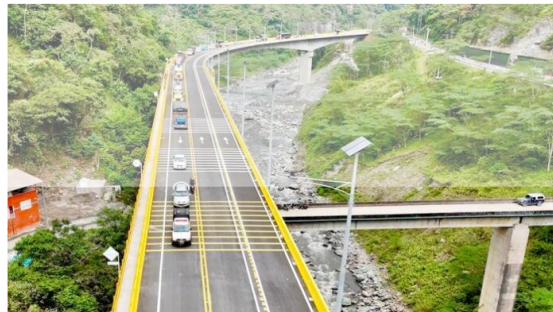
El viaducto del kilómetro 58 de la vía Bogotá – Villavicencio cuenta con una longitud de 720 metros y está compuesto por una estructura de 6 apoyos, conformada por 2 estribos y 4 pilas diseñados para soportar las exigencias geológicas y climáticas de la zona. Adicionalmente, consta de 3 luces centrales cada una de 180 metros y 2 de 90 metros cada una.

Honrando el compromiso del Gobierno Nacional con las comunidades de las distintas regiones del país, el Instituto Nacional de Vías, Inviás, dio al servicio el viaducto del kilómetro 58 de la vía Bogotá – Villavicencio a la altura del municipio de Guayabetal, una importante obra de infraestructura que soluciona de manera definitiva el problema de transitabilidad en este punto que históricamente ha presentado inconvenientes por las condiciones geológicas de la zona.