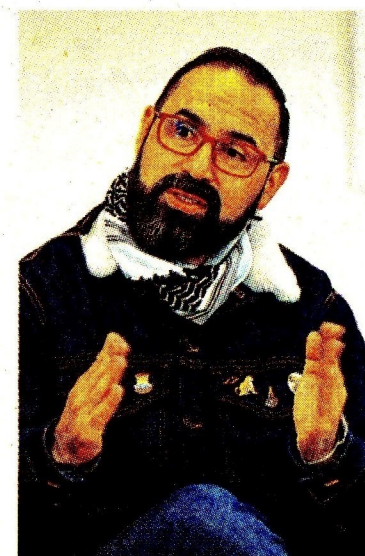
Andrés Camacho, ministro de Minas y Energía.

“Somos respetuosos con el legítimo actuar de las Instituciones en el marco de la normatividad colombiana. Asimismo, reconocemos el compromiso de Naturgas en la promoción de los beneficios del gas natural a más de 36 millones de colombianos. Los gremios desempeñamos un papel fundamental en la representación de la ciudadanía, los profesionales y los sectores productivos, siendo un puente clave entre las necesidades del país y la formulación de políticas públicas efectivas”, resaltaron. ☺