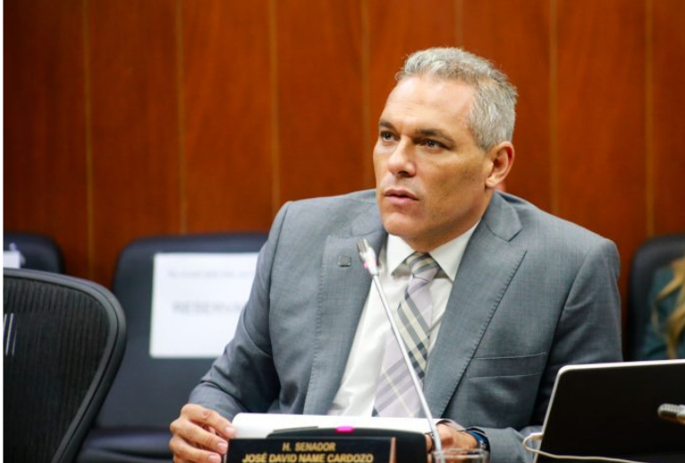
José Name Cardozo.

Por José David Name Cardozo Senador de la República Partido de la U