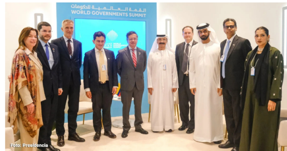
La comitiva de Petro y la delegación de Emiratos Arabes

En diciembre ya había estado el canciller Luis Gilberto Murillo en Qatar a donde irá el Presidente para asistir en el Foro de Doha. Murillo sostuvo una reunión bilateral con el Ministro de Estado de Relaciones Exteriores de Qatar, Sultan Bin Saad Al Muraikhi y donde se destacaron avances claves en la relación bilateral y se proyectaron iniciativas estratégicas para el futuro.