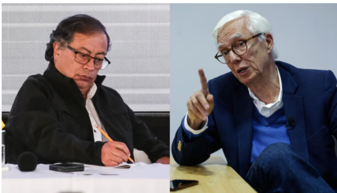
El candidato a la Alcaldía Jorge Enrique Robledo le envió un mensaje directo al presidente Gustavo Petro, todo por el metro de Bogotá

Ahora puede seguirnos en Facebook y en nuestro WhatsApp Channel .