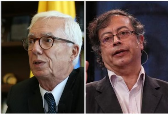
Jorge Enrique Robledo afirmó que Petro era un arribista que gastaba recursos haciendo viajes internacionales que no le servían al país

Finalmente, Robledo afirmó que solo tiene a favor la ironía. Citando a un "amigo" suyo, el excandidato presidencial comentó que la mejor forma de liderar que tenía el primer mandatario era no estar en el cargo de presidente: "A favor de Petro, lo único que cabría es la ironía que me comentó un amigo: "como Petro gobierna tan mal, lo mejor es que no gobierne y que facilite el mayor desgobierno".