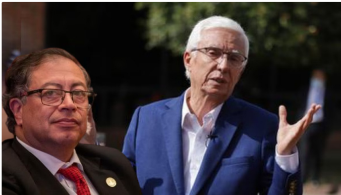
El ex candidato presidencial atacó al actual mandatario teniendo en cuenta las dificultades del país

Gustavo Petro tomó la decisión de viajar a Dubái pese a que varios funcionarios del gabinete ministerial tomaron la decisión de presentar su renuncia irrevocable luego del Consejo de Ministros televisado llevado a cabo el 4 de febrero de 2025.