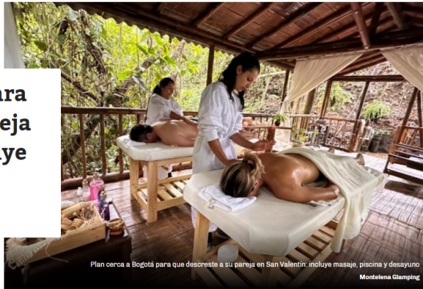
Plan cerca a Bogotá para que descreste a su pareja en San Valentín: incluye masaje, piscina y desayuno