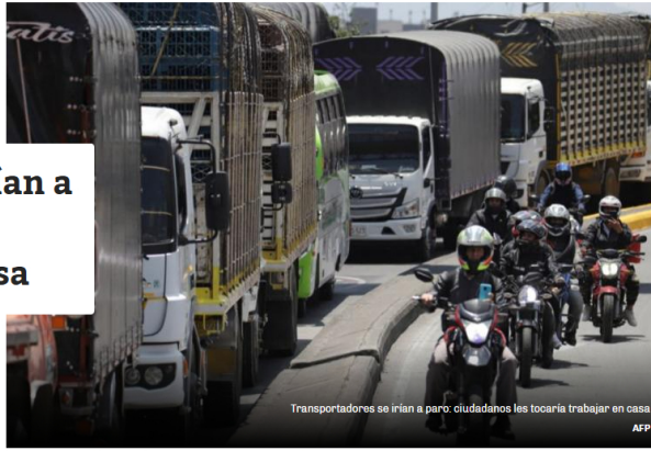
Transportadores se irían a paro: ciudadanos les tocaría trabajar en casa

Por: María Fernanda Tarazona Martínez @Mariafatara