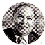
Amylkar Acosta Exministro de Minas y Energía

“Ecopetrol tendría que pagar una penalidad por su desistimiento del orden de US$400 millones. Daría al traste con su régimen corporativo y le acarrearía un enorme costo reputacional”.