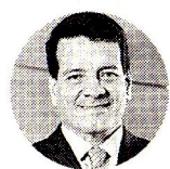
Felipe Bayón Expresidente de Ecopetrol

“El promedio en el portafolio de Ecopetrol es de 64kgCO 2 /ba-