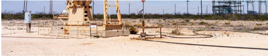
La negativa de Ecopetrol , por injerencia del Gobierno, a participar en un valioso proyecto de fracking en el Permian, en Estados Unidos, todavía retumba en el manejo del gobierno corporativo de la firma.

a la fallida negociación de CrownRock; en esta ocasión sí hay un contrato firmado y seguramente genera penalidades si llega a haber una terminación temprana o un incumplimiento. Y eso es algo que tendrá que analizar con detalle la Junta Directiva de Ecopetrol ".