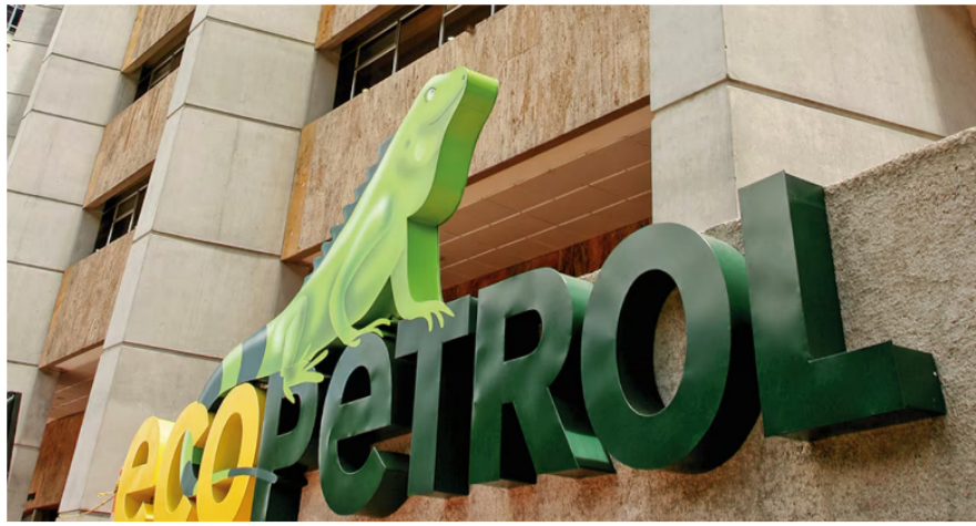
Según la USO, si los niveles de producción de Ecopetrol caen, la empresa verá comprometida su viabilidad.