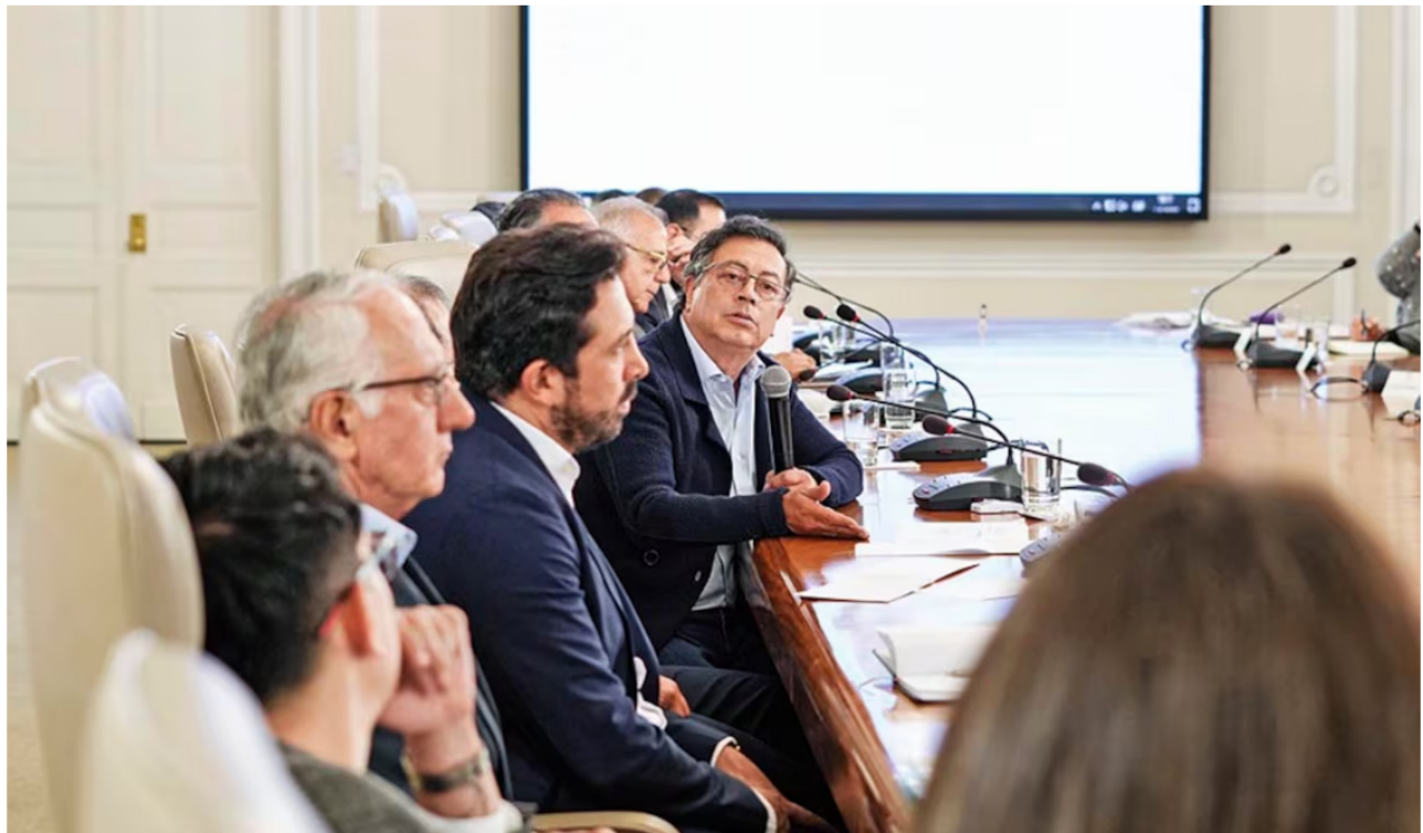
Tras el anuncio de la prórroga del contrato de fracking en Estados Unidos, el presidente Petro en el consejo de ministros le pidió a Ecopetrol que venda esos activos.

El pasado lunes 3 de febrero, Ecopetrol anunció una decisión crítica para su producción de crudo: la extensión por un año más del plan de desarrollo del Midland, en la cuenca del Permian, en Texas, Estados Unidos, dentro del contrato suscrito desde julio de 2019 con la Oxy.