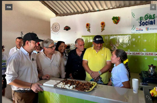
LAS COMUNIDADES DEL CORREGIMIENTO DE SIBARCO SE MOSTRARON MUY SATISFECHAS CON LA LLEGADA DE GAS SOCIAL.

En el corregimiento de Sibarco, municipio de Baranoa, Ecopetrol, la Gobernación del Atlántico y Gases del Caribe socializaron la segunda etapa del proyecto Gas Social, con la que se proporcionará acceso al gas natural a 4.000 familias de estrato 1 y 2 en los municipios atlanticenses de Baranoa, Galapa, Juan de Acosta, Malambo, Manatí, Palmar de Varela, Piojó, Polonuevo, Repelón, Sabanalarga, Santo Tomás, Suan y Usiacuri.