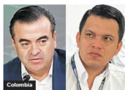
Fiscalía acusó a Olmedo López, Sneyder Pinilla y otros por corrupción en la UNGRD