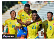
Colombia choca hoy frente a Brasil