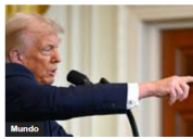
Trump propuso transformar a Gaza sin intervención militar