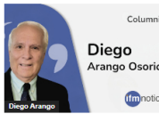
(OPINIÓN) El sufrimiento de Venezuela. Por: Diego Arango