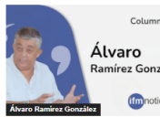
¿Otra reforma tributaria para mantener ese circo? Por: Álvaro Ramírez González