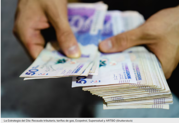
La Estrategia del Día: Recaudo tributario, tarifas de gas, Ecopetrol, Supersalud y ARTBO

Hoy hablaremos sobre el recaudo tributario para 2025, el incremento en las tarifas de gas, Ecopetrol, la Supersalud y ARTBO