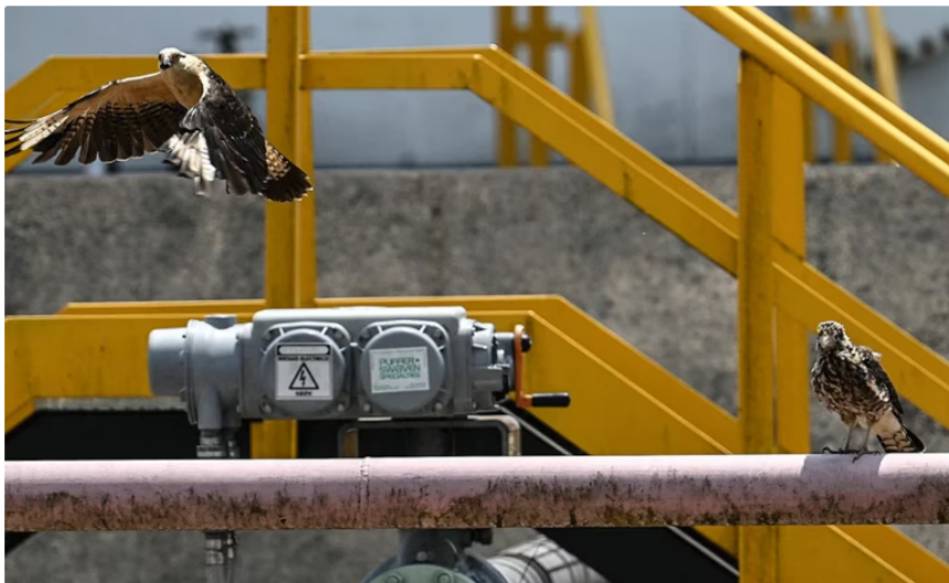
Ecopetrol puso en marcha un proceso de venta dirigido a empresas del sector energético

El gas que sería comercializado proviene de los campos Cusiana, Cupiagua y Cupiagua Sur, ubicados en el departamento de Casanare, una de las zonas más relevantes en la producción de este recurso. Según explicó la empresa, la venta se orientaría principalmente a cubrir la demanda esencial, lo que implica priorizar el suministro para hogares, el transporte de gas a nivel nacional, pequeños comercios y el gas natural vehicular.