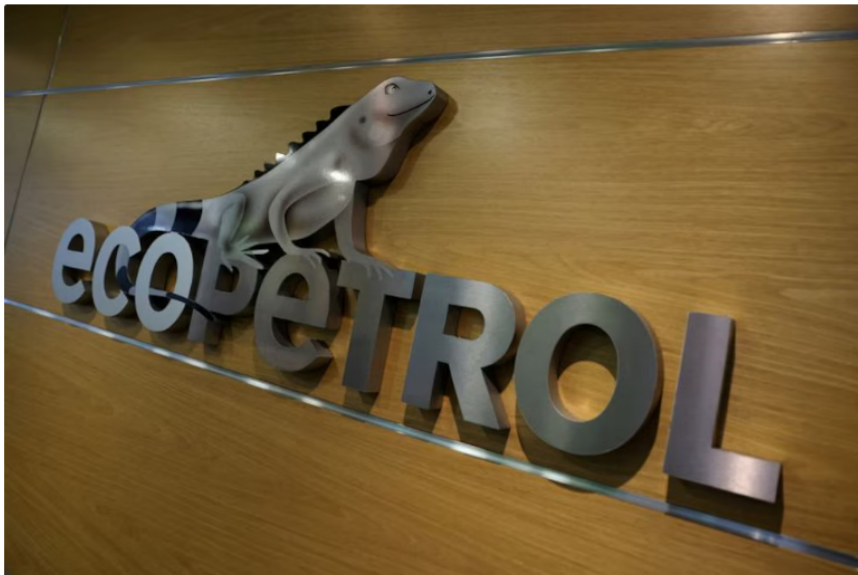
Con un costo de 452 millones de dólares, Ecopetrol adquirió el 100% del CPO-09

Luego de obtener las aprobaciones regulatorias necesarias, Ecopetrol consolidó su dominio en el bloque petrolero CPO-09, ubicado en el departamento del Meta, al completar la adquisición del 45% de participación que hasta entonces pertenecía a la multinacional española Repsol. Con esta transacción, que fue valorada en 452 millones de dólares, la petrolera estatal pasó a ser la única operadora de esta área clave para la producción de crudo en los Llanos Orientales.