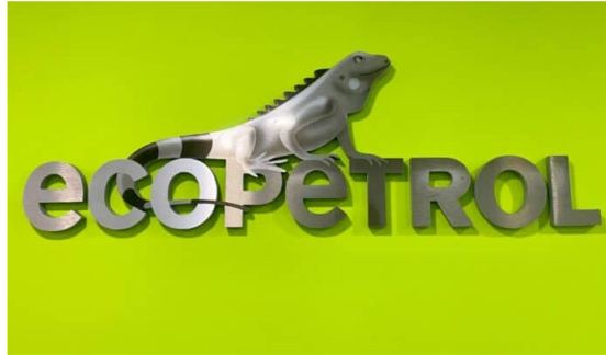
Ecopetrol cierra compra de participación de Repsol.

Ecopetrol informó que concluyó la transacción para adquirir el 45 % de participación que tenía Repsol Colombia Oil & Gas Limited en el bloque CPO-09, por un valor de US$452 millones.