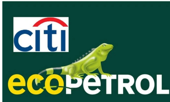
Alertas de Citi, USO y Acipet sobre operación de fracking de Ecopetrol en EE. UU..

Ante las exigencias del presidente de Colombia, Gustavo Petro Urrego, sobre vender la participación que tiene Ecopetrol en la cuenca del Permian (Texas, Estados Unidos), en la que se producen hidrocarburos por medio del fracking en asocio con la petrolera OXY, Citi y otros actores han elevado sus alertas al sector y al Ejecutivo. ¿Qué dijeron?