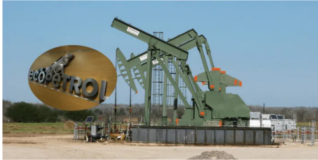
Ecopetrol acordó, solo el lunes pasado, extender un contrato con Occidental Petroleum.

El presidente Gustavo Petro se refirió, en medio de la crisis ministerial, sobre un negocio de Ecopetrol en Estados Unidos.