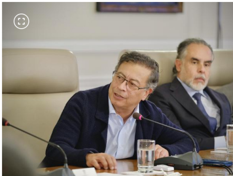
Presidente Gustavo Petro y Armando Benedetti en el Consejo de Ministros televisado.

Colombianos están pagando una obra para energías limpias desde 2022 que no se podría usar cuando se termine de construir