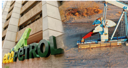
El ADR en la Bolsa de Valores de Nueva York cae 1,5 % hasta US$ 9,48.

El ADR en la Bolsa de Valores de Nueva York cae 1,5 % hasta US$ 9,48, mientras que la acción en la BVC, retrocede 2,93 % hasta $ 1990.