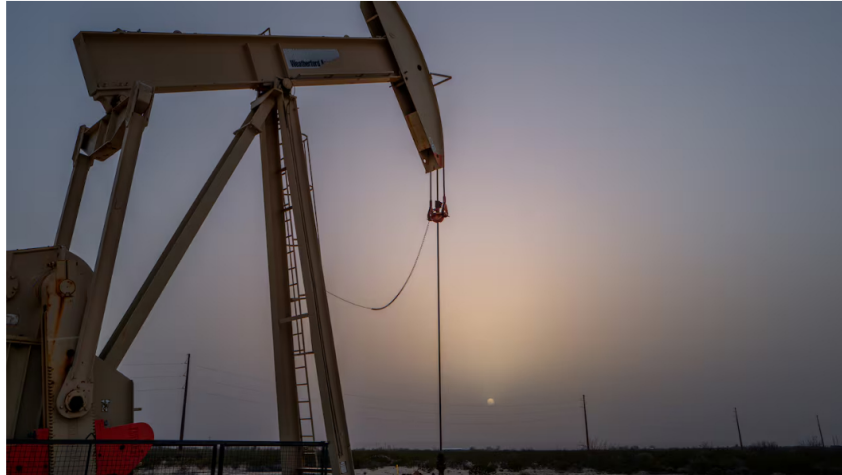
El Gobierno Nacional ha sido crítico frente a la utilización del fracking.

5 de febrero de 2025 Por: Redacción El País