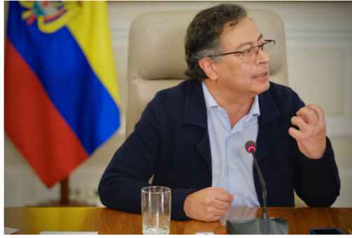
El pronunciamiento de Petro se produjo horas después de que este mismo martes la estatal energética renovara el pacto con su socia OXY.

porque les tenemos miedo. Yo no les tengo miedo”.