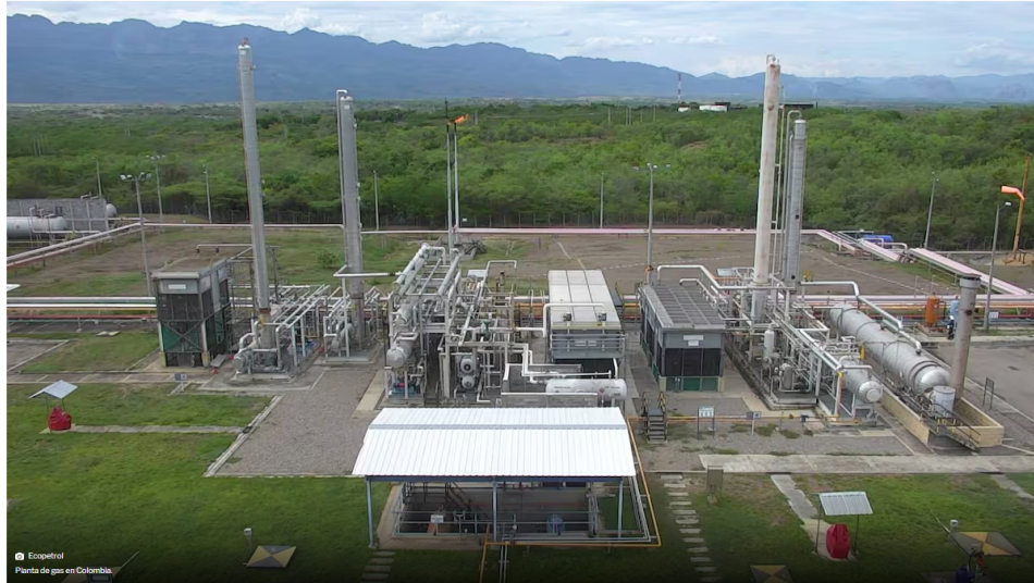
Ecopetrol Planta de gas en Colombia.