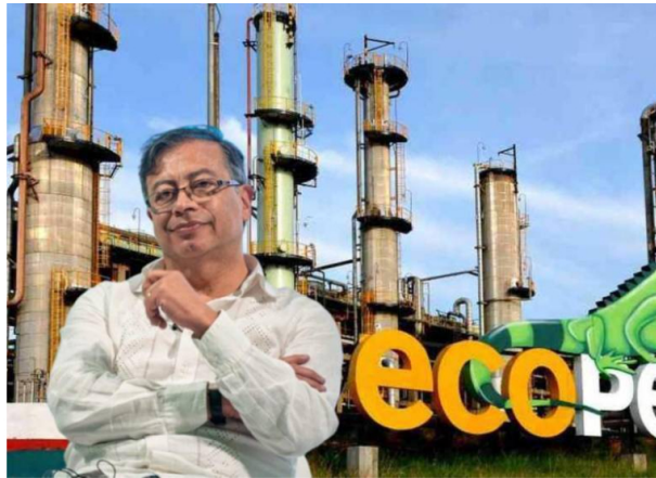
Mientras tanto, el mercado sigue a la espera de si Ecopetrol acatará la petición presidencial o si encontrará una manera de sostener su operación en una de las cuencas más rentables del mundo.

El presidente colombiano insiste en que Ecopetrol abandone el fracking en EE. UU., poniendo en jaque su producción y desatando críticas del sector petrolero.