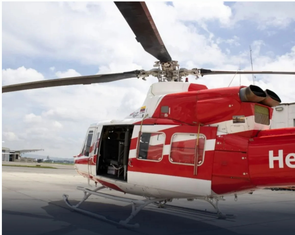
¿Existen incumplimientos en el contrato entre Helicol y Ecopetrol?

Un informe publicado por la Wradio dio cuenta de los motivos que tuvo la empresa Ecopetrol para terminar el contrato con la empresa de helicópteros Helicol.