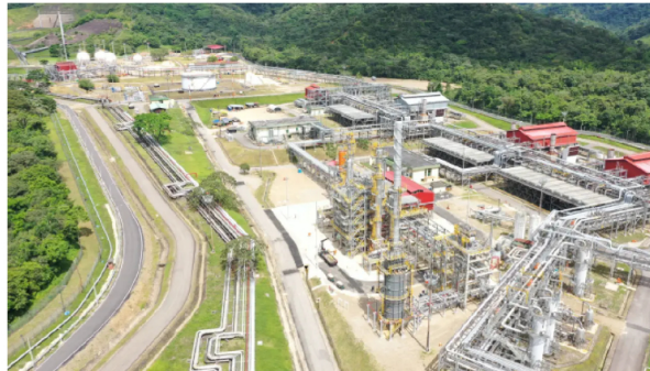
Ecopetrol refuerza el abastecimiento de gas natural

La decisión de Ecopetrol de poner a disposición estas cantidades de gas responde a su compromiso con la estabilidad del mercado y la seguridad energética del país.