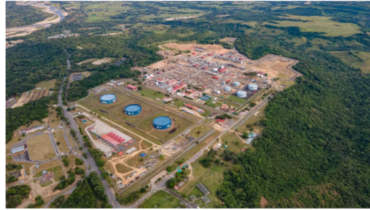
Ecopetrol refuerza el abastecimiento de gas natural