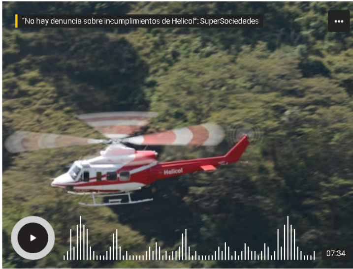
Helicóptero de Helicol.