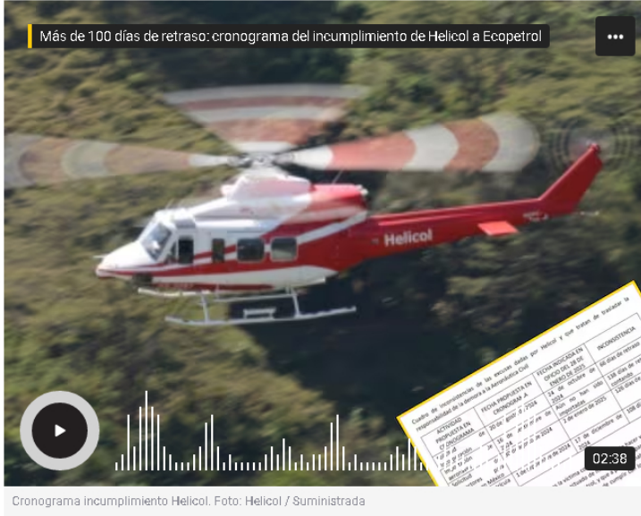
Cronograma incumplimiento Helicol.

La W accedió al cronograma de la Aeronáutica Civil en el que se evidencia el incumplimiento de Helicol.