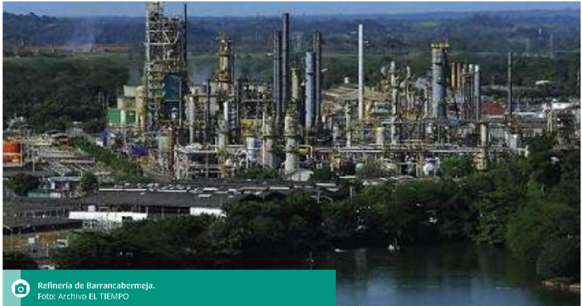
Refinería de Barrancabermeja.

Según Ecopetrol, este mantenimiento tendrá una duración de 74 días y comenzaría en marzo.