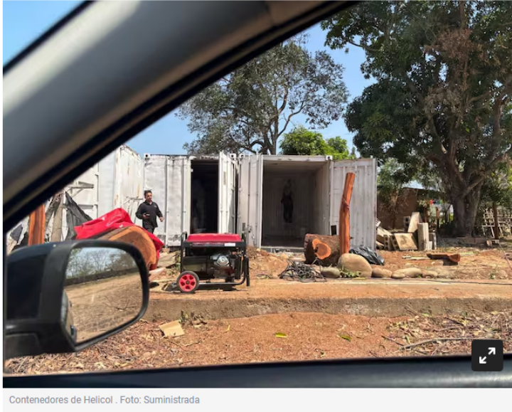
Contenedores de Helicol .