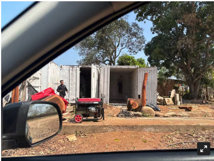
Contenedores de Helicol .

La W tuvo acceso a imágenes tomadas por Ecopetrol este 3 de febrero de 2025 en el que se evidencia el estado de la base de Ariporo y los contenedores que utilizan como 'oficinas'.