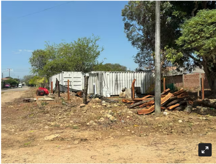
Contenedores de Helicol.