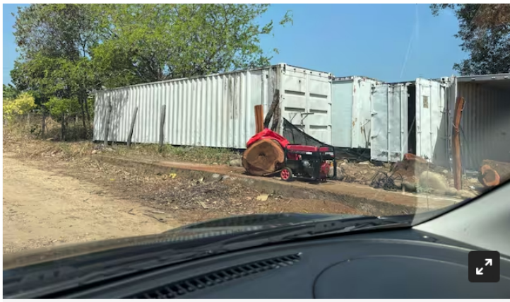
Contenedores de Helicol.