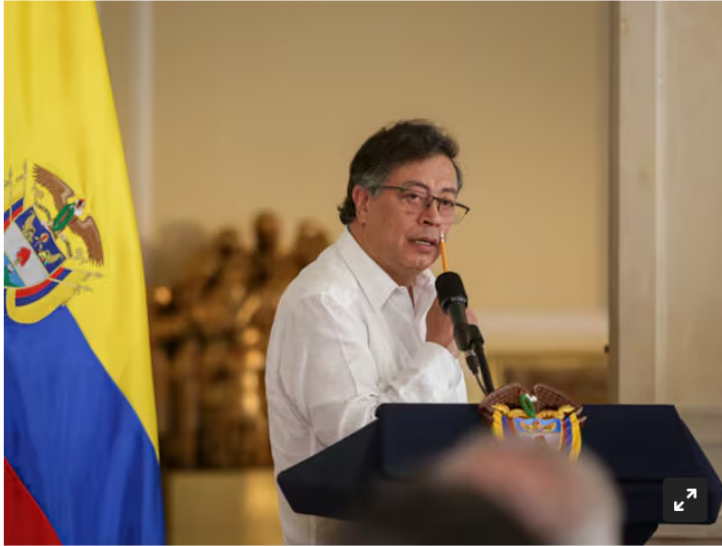
Gustavo Petro, presidente de Colombia.

Según el presidente de la República, el fracking "es la muerte de la naturaleza y de la humanidad".