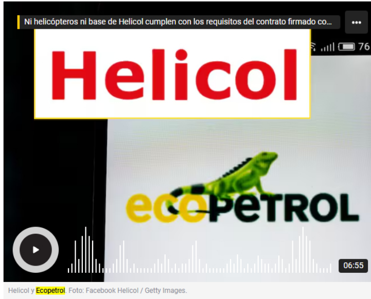
Helicol y Ecopetrol .

La W conoció un documento de Ecopetrol en el que se detallan las causales de terminación de contrato con la empresa Helicol.