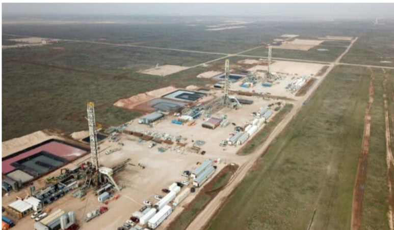
Petro pide vender operación de fracking de Ecopetrol en el Permian de EE. UU.

El presidente de Colombia, Gustavo Petro Urrego, se refirió este martes (4 de febrero de 2025) a la ampliación del acuerdo entre OXY y Ecopetrol de mantener las operaciones de fracking en la cuenca del Permian en Texas (Estados Unidos): el mandatario se opuso a la medida y pidió vender dichos activos. ¿Por qué?