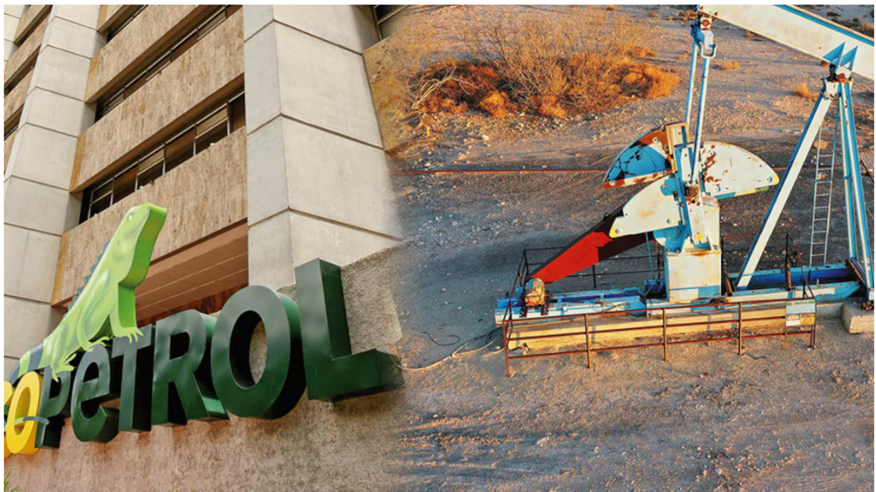
La negativa de Ecopetrol a un nuevo negocio en Estados Unidos con fracking desató una polvareda e incluso la salida de dos miembros de la junta directiva.

En la tarde del lunes 3 de febrero de 2025, el presidente de Ecopetrol , Ricardo Roa, anunció la extensión del plan de desarrollo de asociación entre la empresa y la Oxy. Se trata de una ampliación al contrato que se venía ejecutando y que estaba a punto de vencerse.