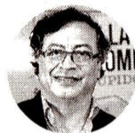
Gustavo Petro Presidente de la República

"¿Acaso Petro es dueño de Ecopetrol ? o ¿tiene acciones? El dueño es el Estado, que nos representa a 52 millones de personas. No a una sola persona. El activo del Permian, donde se produce con fracking, es el más productivo de Ecopetrol . Es el que ha evitado que la producción de la compañía caiga dentro de la legión de pésimas decisiones de este Gobierno de pesadumbre, esta tendría un lugar superlativo", indicó Echeverry , quien fue presidente de Ecopetrol entre 2015 y 2017.