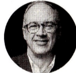
Juan Carlos Echeverry Exministro de Hacienda

"Nosotros estamos contra el fracking, porque es la muerte de la naturaleza y la humanidad. Quiero que se venda la operación para que se invierta en las energías limpias".