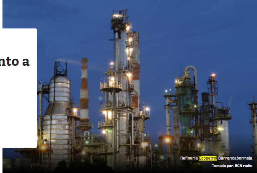
Refinería Ecopetrol Barrancabermeja