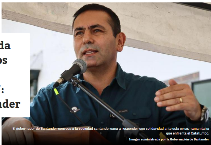
El gobernador de Santander convoca a la sociedad santandereana a responder con solidaridad ante esta crisis humanitaria que enfrenta el Catatumbo.

Por: Juan David Quijano Castillo @juanquijano08