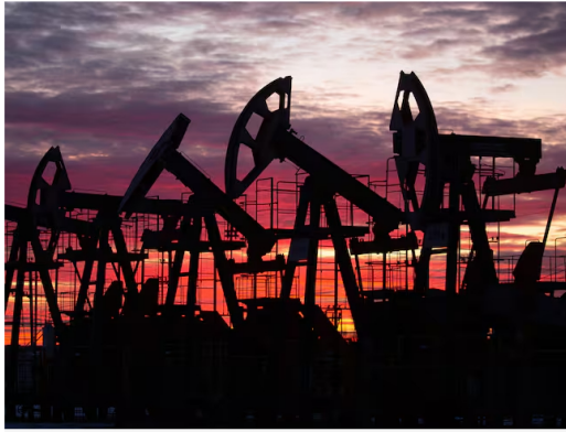
Extracción de petróleo

El acuerdo va acompañado de inversiones por hasta 880 millones de dólares en una de las cuencas que es reconocida en el mundo por tener grandes reservas de hidrocarburos.