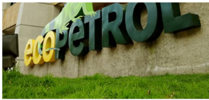
Ecopetrol selló millonario acuerdo con Oxy para aumentar exploración en Estados Unidos

"Ecopetrol y Oxy mantendrán activo un contrato independiente para el desarrollo de la subcuenca de Delaware, que continuará vigente hasta 2027", informó la estatal petrolera.