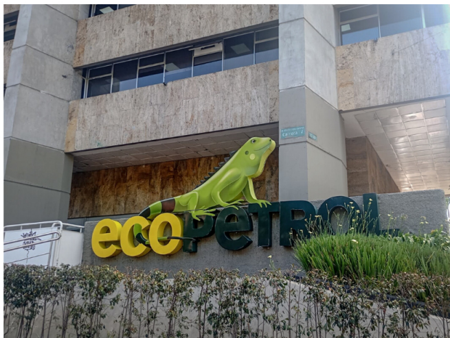
Ecopetrol obtiene la segunda mejor calificación en el segmento de petróleo y gas integrado a nivel mundial del Índice de Sostenibilidad Dow Jones

La petrolera obtuvo 79 puntos sobre 100 en la evaluación, con una mejora de seis puntos con respecto a su calificación el año anterior.