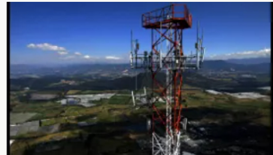
Mintic refuerza telecomunicaciones en Catatumbo ante emergencia