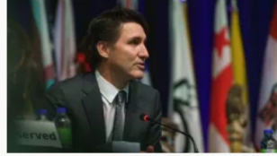
Trump pospone aranceles a Canadá tras acuerdo sobre lucha contra el fentanilo