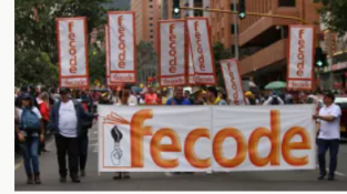
De apoyar Reforma a la Salud a protestar por falta de medicamentos: la contradicción de Fecode