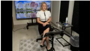
Casa Blanca critica gasto de Usaid en ópera trans en Colombia