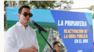
Ecuador cerrará fronteras con Colombia y Perú por elecciones presidenciales