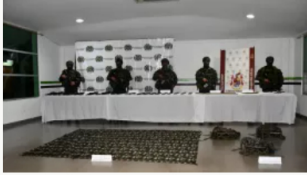
Ejército Nacional rescata a seis menores reclutados en Guaviare