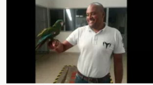
Investigan a exgobernador de San Andrés por presuntas irregularidades en millonario proyecto turístico