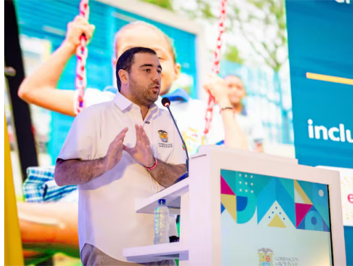
Gobernador de Bolívar Yamil Arana rindió cuentas en Magangué

El mandatario destacó los logros, apuestas y resultados de su primer año de gobierno: "Llevamos la administración al territorio con obras y servicios"