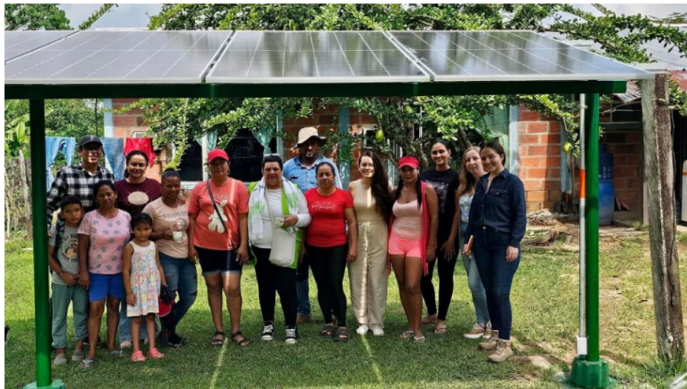
Esta es la comunidad energética de Ecomacias, en Puerto Parra, Santander.