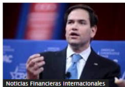
Noticias Financieras Internacionales

Bolsa de Colombia subió 10 % al inicio de 2025: estas fueron las acciones más destacadas en enero