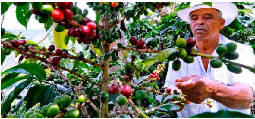
Precio de la libra de café en bolsa se elevó 95% en el último año.