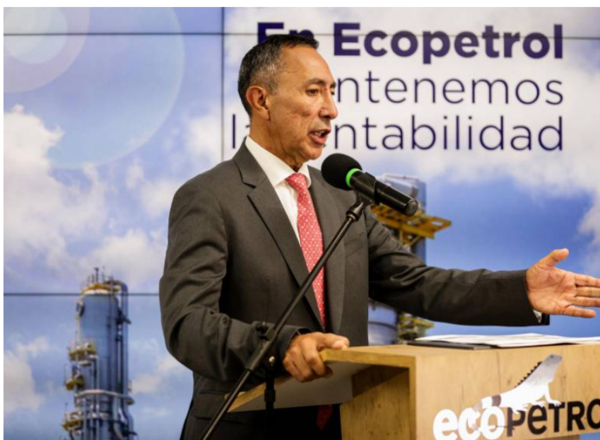
Ricardo Roa Barragán, presidente de Ecopetrol

Los inversionistas vieron en la caída de la acción de Ecopetrol una oportunidad de compra el año pasado, impulsando su precio hasta los $2.025 en la jornada del 30 de enero.