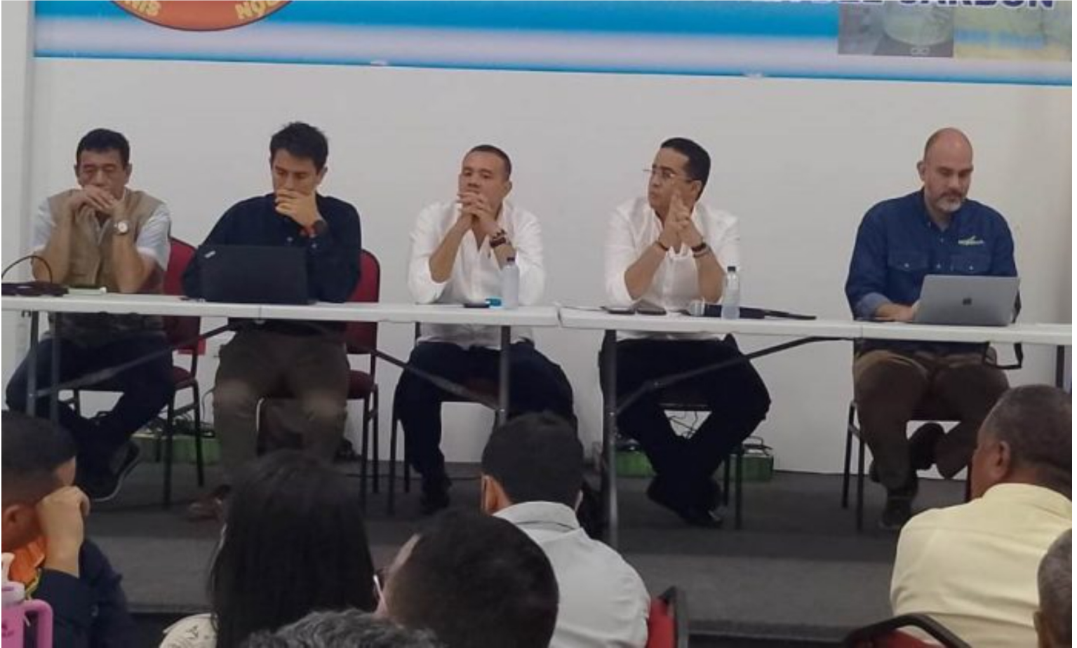
Esta es la reunión que se realizó en las instalaciones de Sintracarbón.

Por Francisco De La Hoz Sarmiento - 30 enero de 2025