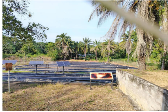
Paneles solares.