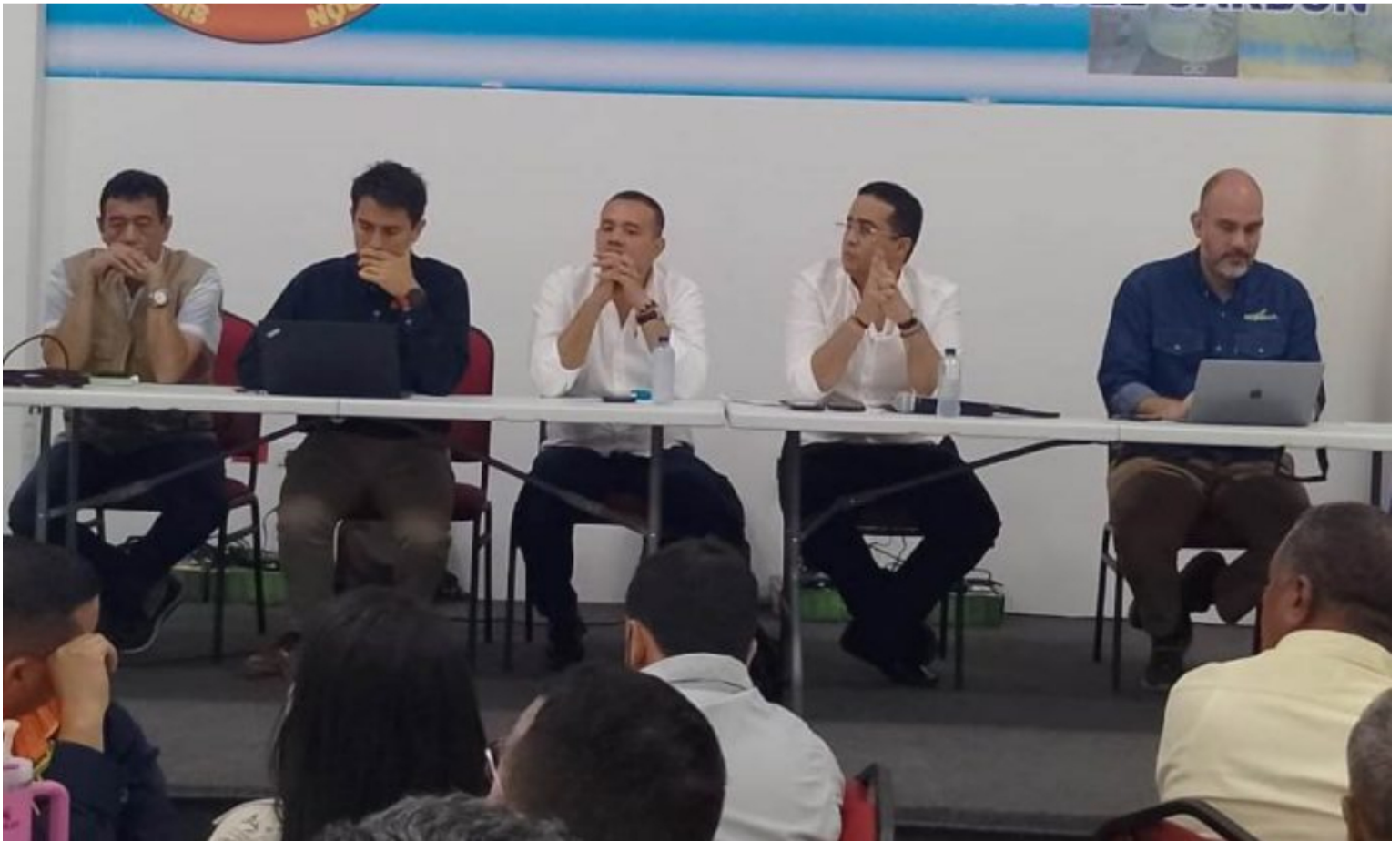
Esta es la reunión que se realizó en las instalaciones de Sintracarbón.

Por Francisco De La Hoz Sarmiento - 30 enero de 2025